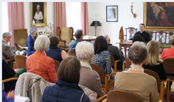
Die Exerzienvorträge werden im Kanonikersaal des Klosters gehalten.

Wir Sie bis Sie, sich bis zum Montag, dem 18. September, anzumelden.