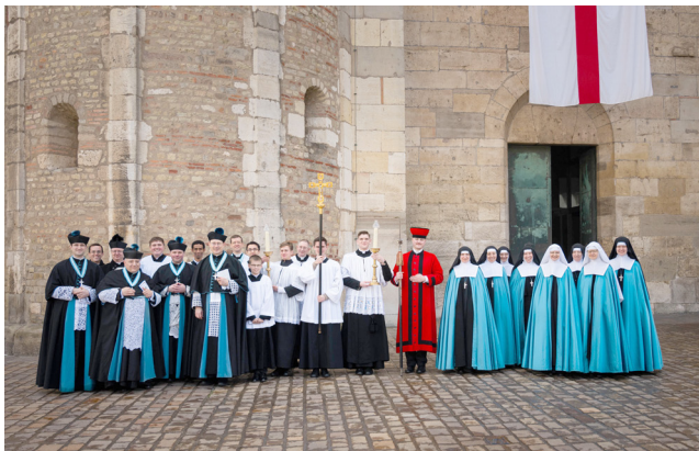
Die Kanoniker von Maria Engelport, die Oblaten und Kandidaten, die Messdiener unseres Trierer Apostolats und die Anbetungsschwestern vor dem Trierer Dom nach der Verehrung der Reliquie des Heiligen Rockes Christi.