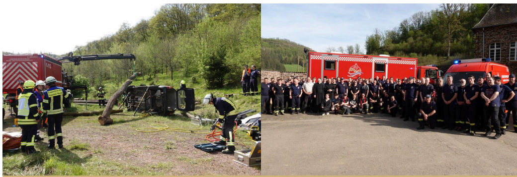
Große Katastrophenschutzübung am 13. April im Kloster Maria Engelport, organisiert und durchgeführt von Feuerwehren aus der Region.