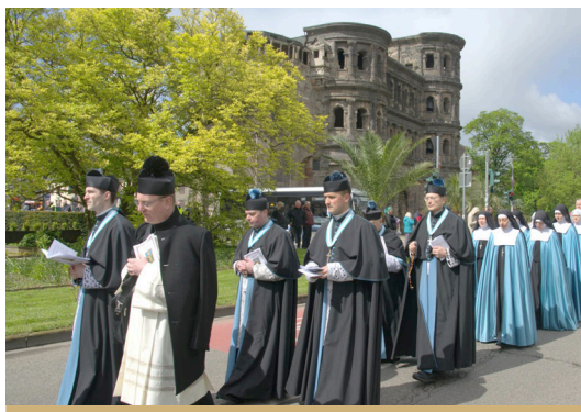
Prozession zur Hohen Domkirche durch die Trierer Innenstadt am 20. April anlässlich der Wallfahrt zu den Heilig-Rock-Tagen