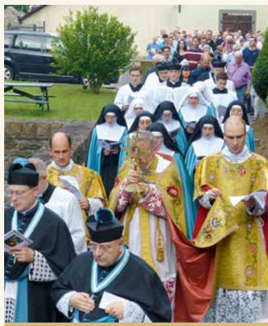
Prozession zu Ehren der heiligen Anna

8.15 Uhr Heilige Messe 10.00 Uhr Choralhochamt zur Ehre der hl. Anna 16.45 Uhr Sakramentaler Segen 17.15 Uhr Heilige Messe, anschließend feierliche Vesper mit sakramentalem Segen