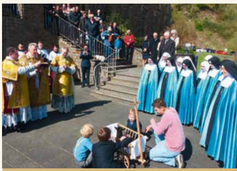
Segnung des Osterlammes