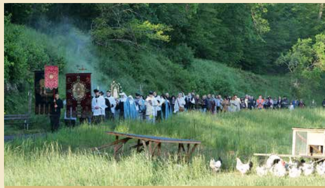
Prozession am Fatimatag.

Für Veranstaltungen oder die Nutzung eines Veranstaltungsraums wenden Sie sich bitte an gast@kloster-engelport.de