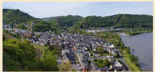
Blick über den Moselort Treis-Karden zum Eingang des Flaumbachtals, das von der Treiser Wildburg bewacht wird und nach Kloster Maria Engelport weiterführt.

Wanderkarten sind in unserem Klosterladen erhältlich.