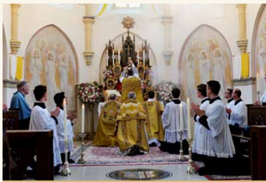
Primizmesse des neugeweihten Priesters

Das Institut Christus König und Hohepriester ist eine Gesellschaft apostolischen Lebens päpstlichen Rechts, dessen Ziel die Ehre Gottes und die Heiligung der Priester im Dienst der Kirche und der Seelen ist. Seine Mission ist es, das Reich Christi in alle Bereiche des menschlichen Lebens hinein auszubreiten. Dabei schöpft es aus dem tausendjährigen Schatz der Römisch-Katholischen Kirche, besonders aus ihrer liturgischen Tradition, der ungebrochenen Linie des geistlichen Denkens und der praktischen Übung ihrer Heiligen sowie aus ihrem kulturellen Erbe, der Musik, Kunst und Architektur. Dies erreicht das Institut vor allem durch eine solide und gut fundierte Ausbildung seiner Priester, die in der katholischen Tradition wurzelt und im internationalen Seminar in der Erzdiözese Florenz gegeben wird. Im Bewußtsein der Notwendigkeit ihrer eigenen Heiligung, bemühen sich unsere Priester darum, durch ihre apostolische Arbeit in den ihnen anvertrauten Kirchen, Schulen, Missionen in Afrika, bei Einkehrtagen, Katechismusunterricht und geistlicher Führung, Instrumente der Gnade Gottes zu sein. Das Institut Christus König wirkt unter der Schutzherrschaft der Unbefleckten Empfängnis, der es geweiht ist.