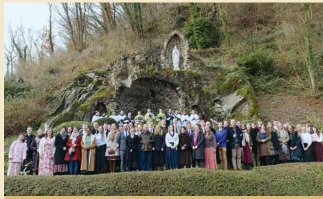
Unsere Gruppe „Sursum corda“. Regelmäßig treffen sich junge Erwachsene zur Einkehr in Kloster Maria Engelport.

Unseren Gästen stehen ein großer, traditionell eingerichteter Klosterkeller mit Barbereich zur Verfügung, eine Gästebibliothek mit Lese- und Studienmöglichkeit im 2. Stock. Mobiles Internet sowie Druckmöglichkeiten in der Gästebibliothek sind vorhanden.