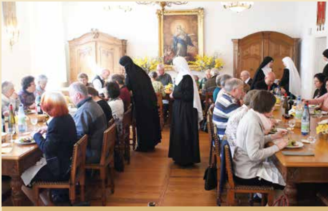
Die Anbetungsschwestern bedienen während der Exerzitien im Gästerefektorium.

Bezahlungen können während der Öffnungszeiten im Klosterladen in bar oder per Karte erfolgen sowie auf Anfrage per Banküberweisung.